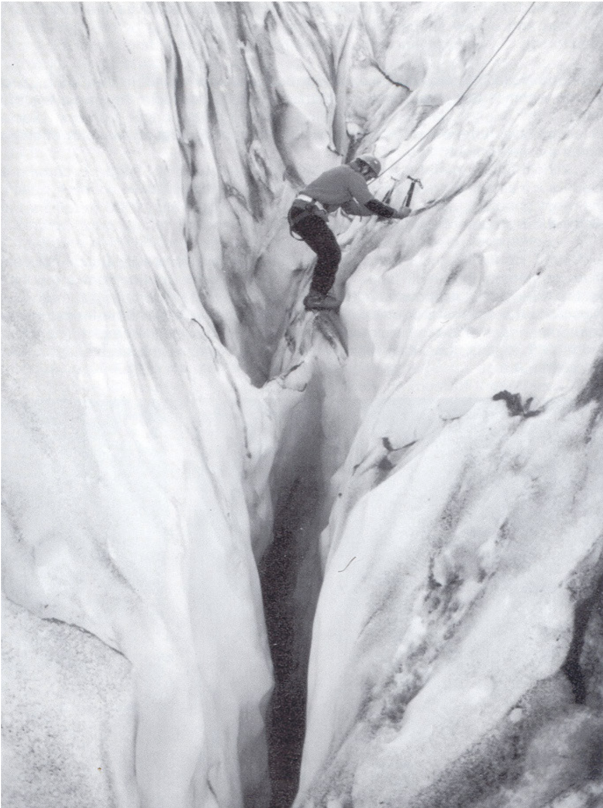
Pratica di arrampicata su parete di ghiaccio del ghiacciaio Gígjökull.