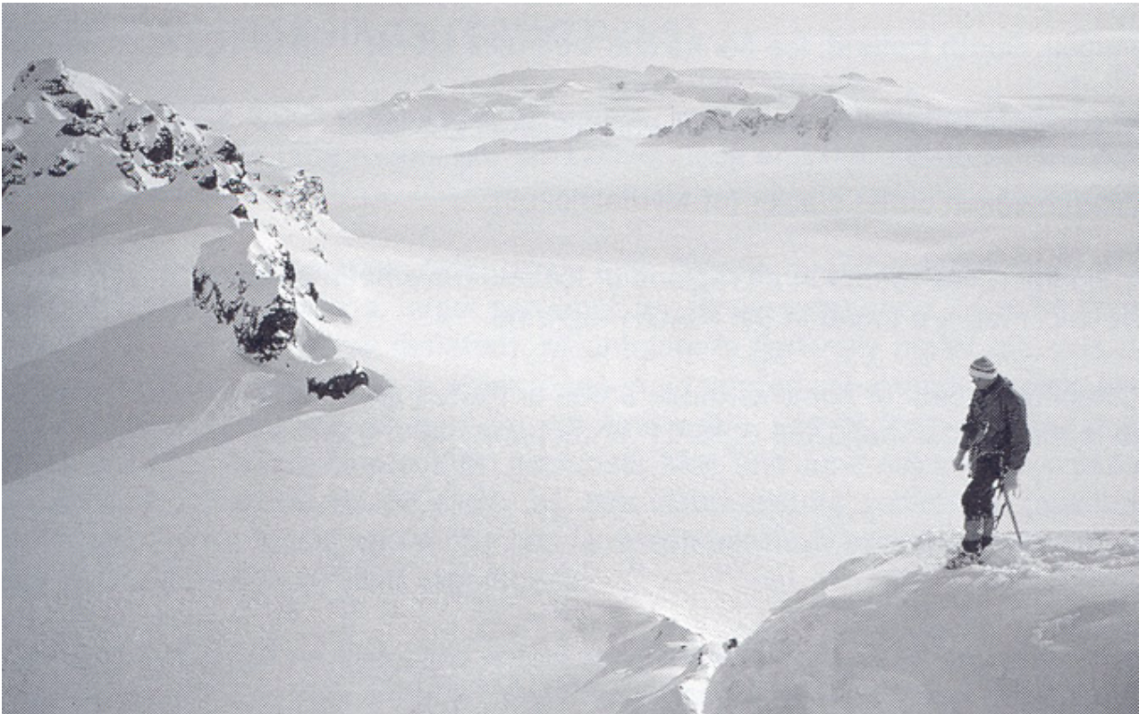
La vasta superficie della calotta glaciale del Vatnajökull. Il monte Öräfajökull sullo sfondo.