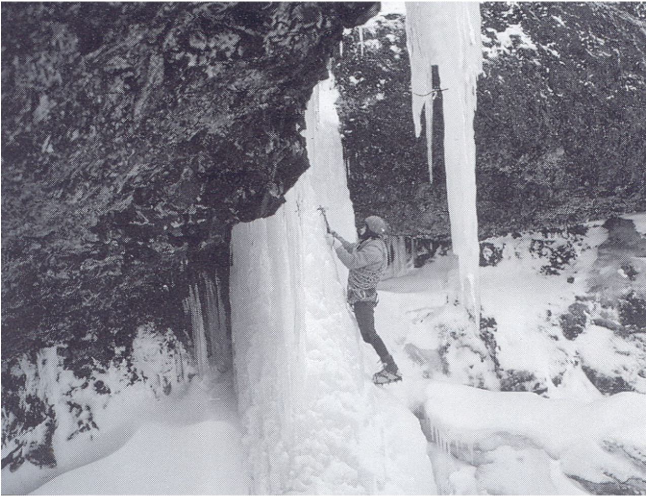
Arrampicata su ghiaccio negli anni 80 (Hvalfjörður).